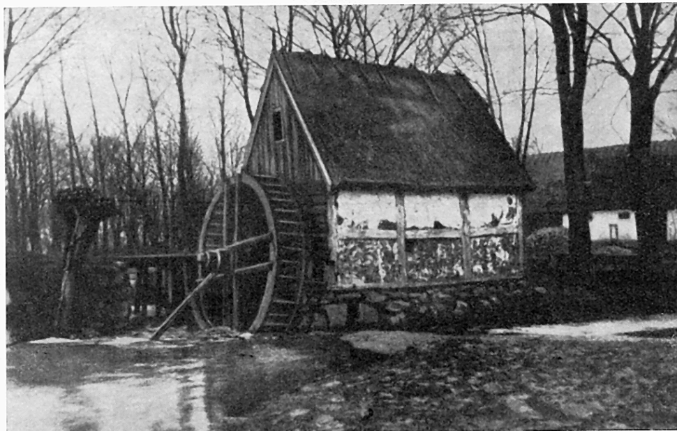
Vattenkvarnen vid Stora Riseberga gård i Husie.

VÄDERKVARNARNA hör liksom de vita kyrkorna till den skånska slättbygdens vackraste blickpunkter där de på höjderna djärvt bryter landets långa, svepande linjespel. De snurrande möllevingarna utgör också ett moment av liv och rörelse i landskapsbilden. De sista årtiondena har emellertid präglats av den stora kvarndöden. Tätorternas stora valskvarnar och övergången till elektrisk drift har medfört, att provinsens gamla vädermöllor antingen helt rivits eller fått sina vingar borttagna. I Malmötrakten, som förr var rik på möllor, har kvarndöden härjat särskilt svårt. Det är nu nästan endast den resliga holländska vädermöllan vid Kronotorp i Burlövs socken som ännu står intakt som ett ärevärdigt monument över idoga somrars mödor, lönade med rika sädesskördar.