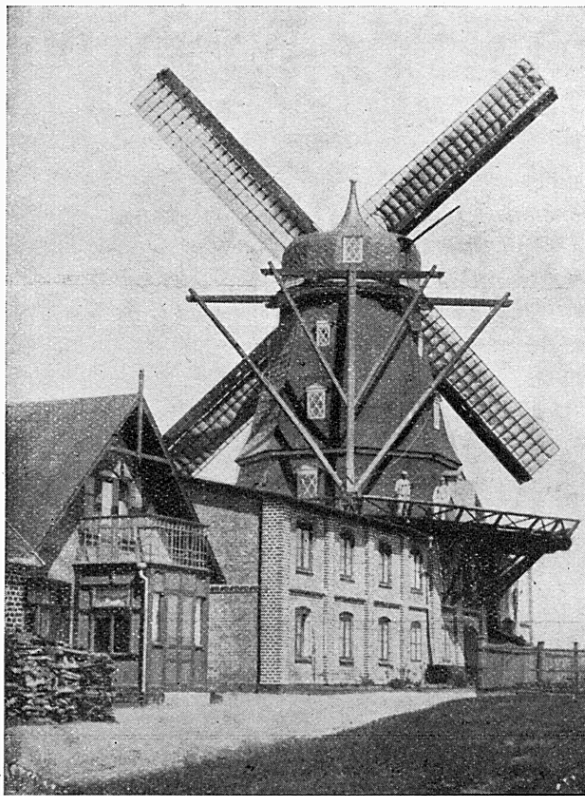
Hohögs kvarn år 1901.

andra holländska möllan i Östra Skrävlinge låg i västra delen av byn vid Sallerupsvägen i Hohög och kallades vanligen "Hohöja mylla". Möllan, som var en av de ansevärdaste och mest värdfulla i Malmötrakten, var uppförd 1862—63. Ett stort magasin uppfördes vid möllan 1901. I äldre handlingar betecknades möllan "Östra Skrävlinge Wäderqvarn 4/721 mtl". Sin blomstringsperiod hade möllan på 1860- och 1870-talen, då fyra eller fem mölleträngar samtidigt hade sysselsättning. Rörelsen lämnade god avkastning, och mjölnaren hade enligt taxeringarna vid denna tid c:a 900 kronor i årlig inkomst, en ansevärd summa för snart hundra år sedan. Då den höga möllan ansågs innebära en allvarlig fara för flygtrafiken på Bulltofta, nedrevs den resliga överbyggnaden med vingarna 1942. Kvarnrörelsen bedrevs i den kvarstående botten delen intill hösten 1957. I Östra Skrävlinge by låg förr också en stubbamölla invid Videdalsgården.